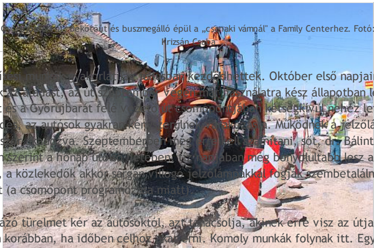
A Győr-Ménfőcsanak közlekedőút és buszmegálló épül a „csanaki vámpál” a Family Centerhez.